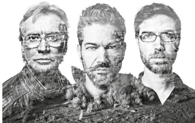
The Rhythm Junkies