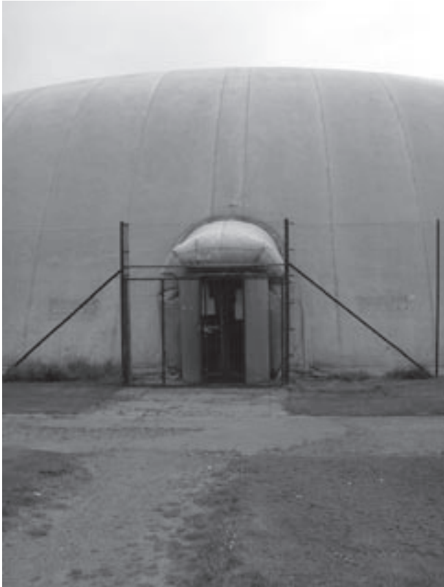
Verwarring over de toestand en toekomst van de ballon.