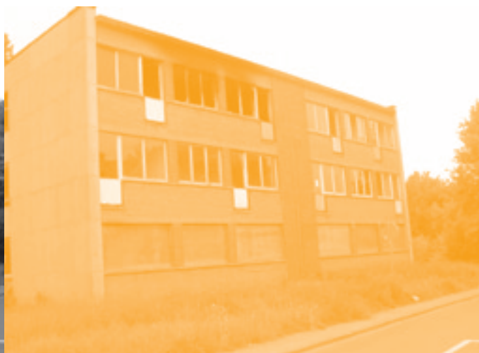
De verlaten woonblokken aan de Denayerstraat worden binnenkort afgebroken.