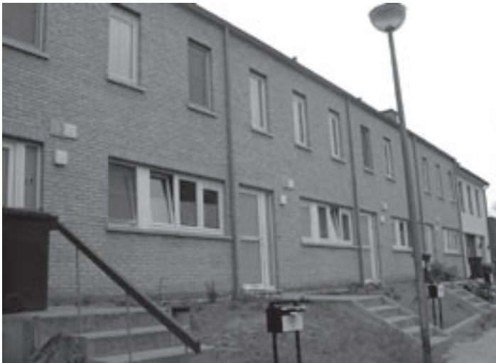
De nieuwe woningen aan de Denayerstraat.