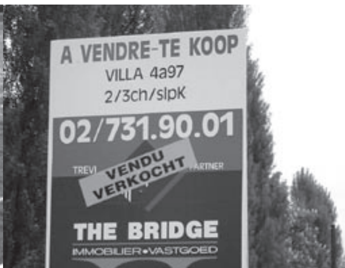
Borden met 'te koop' of 'te huur' blijven veel te lang staan.