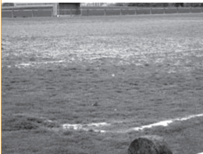
Nieuw gras moet de voetbalterreinen opnieuw speelbaar maken.