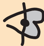
PROVINCIE VLAAMS • BRABANT