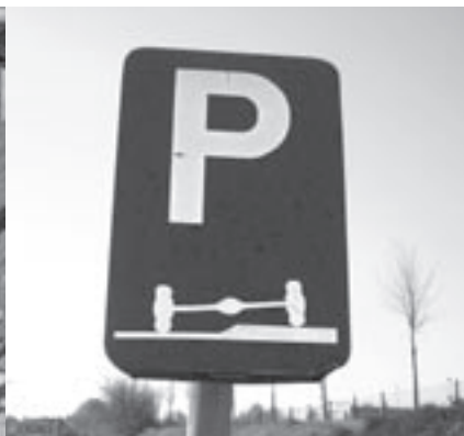
Foutparkeerders leveren verkeersproblemen op aan het voetbalveld.