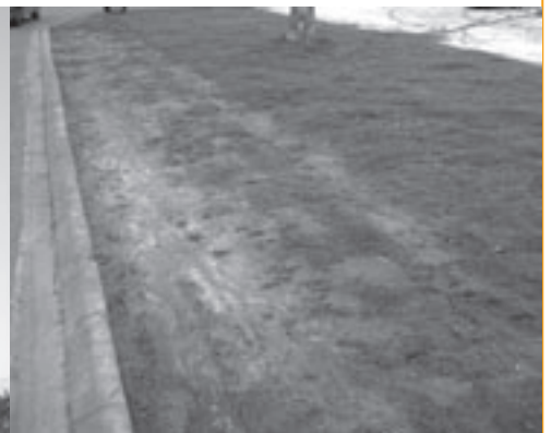
Op sommige grasperken staat nauwelijks gras.

> Jean Rosseeuw (Union) wilde het voorstel voor het heffen van een gemeentebelasting bij het opruimen van sluikstorten amenderen. "Het voorstel dat nu ter tafel ligt, maakt geen onderscheid in de boetes. Of het nu om een pekelzonde of een zware overtreding gaat, de overtreder betaalt altijd 400 euro. Mijn voorstel is een standaardboete van 100 of 125 euro, afhankelijk of er moet opgeruimd worden of niet en een extra boete van minimum 400 euro, op te leggen bij grote opruimingswerken." Schepen d'Oreye-de Lantremange kon niet akkoord gaan met dit "spontaan amendement", dat er volgens hem "onder druk vanuit een bepaalde hoek kwam". Hij stelde voor om de standaardboete van 400 euro te behouden en na een jaar te evalueren en dan eventueel aan te passen. "Dergelijke zaken moeten trouwens ook besproken worden in de begrotingscommissie", zei d'Oreye de Lantremange nog. Louis Hereng (K2000) en Luk Van Biesen (K2000) merkten op dat er de voorbije jaren geen enkele boete voor sluikstorten geïnd werd. "Het is al te makkelijk om de mensen met dreigende vinger duidelijk