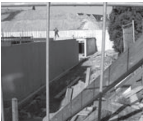
De aannemer die de werken uitvoert aan het Kerkeveld moet het lastenboek volgen.