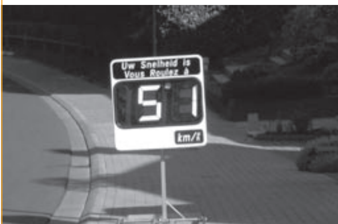
Verplaatsbare snelheidsborden moeten autobestuurders aanzetten hun snelheid te matigen.