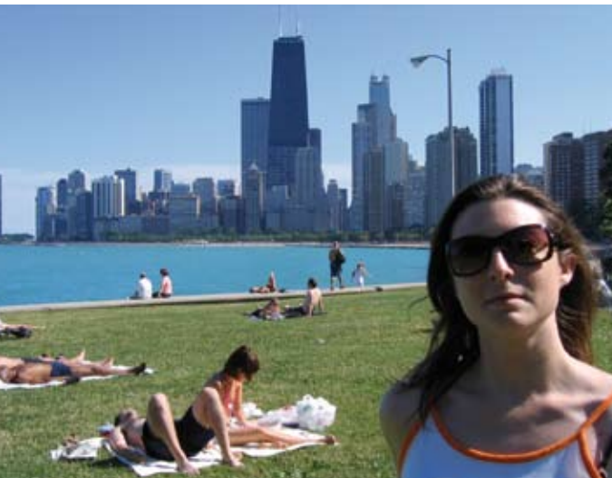
Lake Michigan met strand.