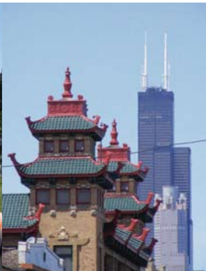
Sears Tower vanuit China Town.