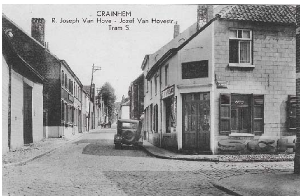
De Jozef Van Hovestraat in de jaren dertig (bovenaan en midden) en in september 1979 (onderaan). Twee huizen verdwenen voor de oprit naar de E40.