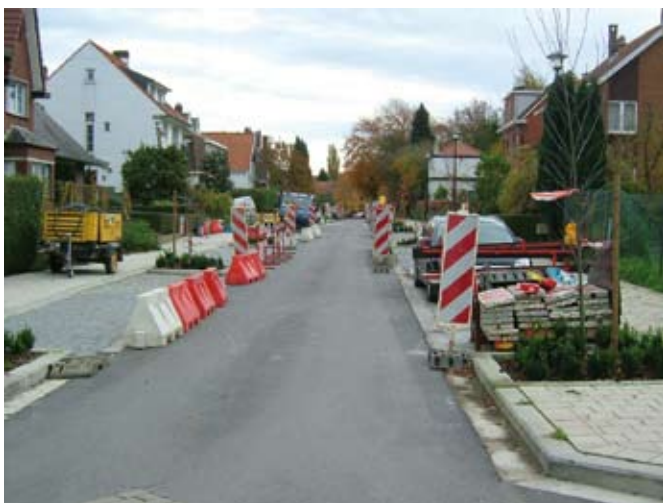
Het gemeentebestuur blijft het antwoord schuldig op de vraag wie de kosten van sommige werken aan de Karel Verhaegenlaan betaalt.